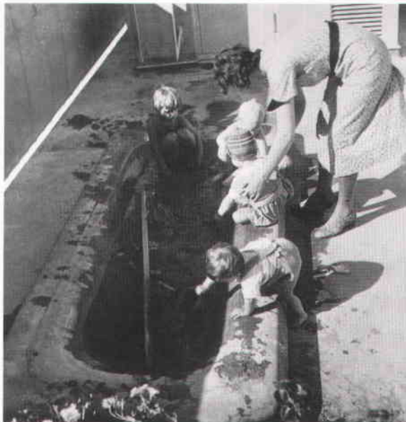
På husets tak fanns solterrass med lekbassäng för de minsta. Foto Viola Wahlstedt 1935. Arkitekturmu-seets arkiv.

Fasaderna fick vid en renovering på 1960-talet en hård cementputs påsprutad och blev snabbt gråa