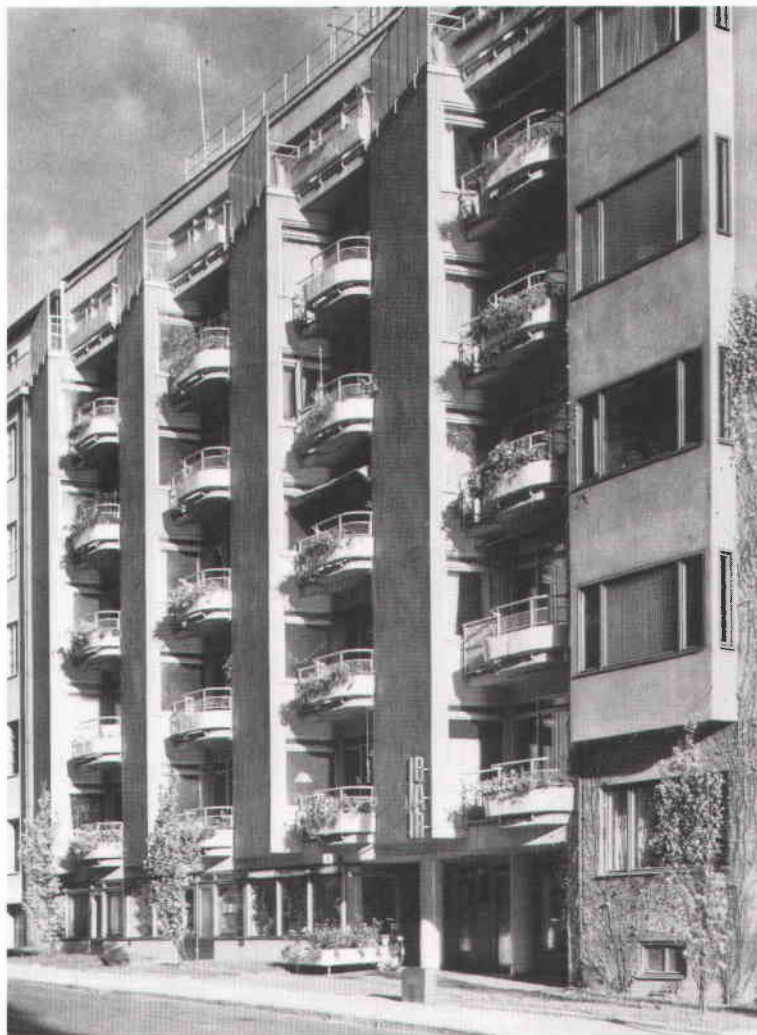
Bilden av gatufasaden visar att balkonglådorna var väl fungerande för sitt ändamål. Foto Kidder-Smith 1936. Arkitekturmuseets arkiv.

tion för husets boende, kunde sända upp mat till lägenheterna via mathissar och hade även öppet för andra matgäster. Daghemmet tog emot husets barn på dagtid och till en början nattetid och drevs i egen regi fram till 1942.