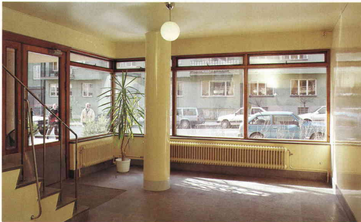
I husets ljusa, rymliga entré har den milda, gula oljefärgen återställt med en teknik, som inte längre är vanlig. Väggarnas lyster förstärker rummets strama arkitektur.

har utförts av Stockholms Byggputs AB. Även entrén har målats på samma sätt som då. Målerifirman Larsson & Örnmark har lyckats göra en blank, slät oljefärg i den ljusa, milda gula kulör, som Sven Markelius skapade när huset var nytt. Riksantikvarieämbetet har lämnat ett ekonomiskt bidrag till fasadrenoveringen och länsstyrelsen till entrémåleriet. Övriga delar av det cirkelrunda trapphuset och korridoren är i gott skick och man var tvungen att där avstå från sådan ytbehandling av kostnadsskäl. Här sitter en grov målad väv från 1970-talet, som förhoppningsvis kan åtgärdas i framtiden.