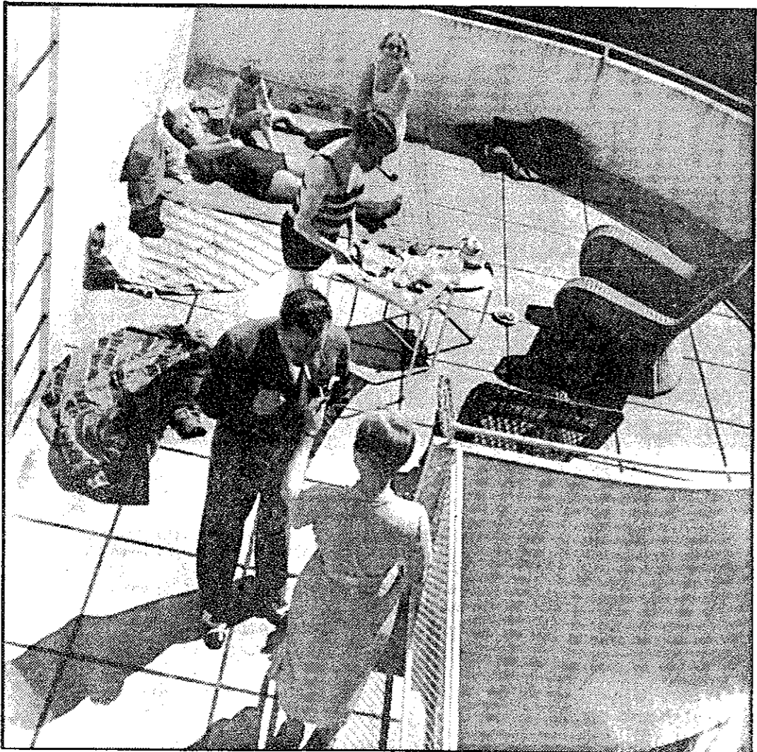
Markelius egen villa i Nockeby från 1930 var ett experiment. Byggnaden göts i armerad betong med korkisolerad på insidan. På den halvcirkelformade absidens altan ses arkitekten själv rökande en cigarett framför närmast vännen Alvar Aalto i badkostym.