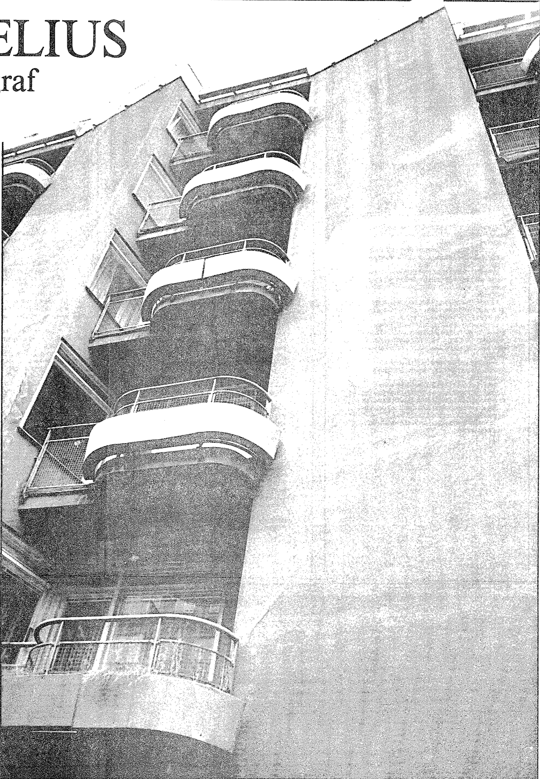
Kollektivhuset vid John Ericssonsgatan 6 från 1935 innehåller 57 små lägenheter med 1–4 rum. Här fanns kindergården för 15 barn, nedkast för sopor och tvätt, städskor och mathiss mellan kokvrån och restaurangen. På takterrassen inrättades plaskdamm, sandlåda och dusch. Här hade Sven Markelius såväl bostad som kontor.

Arkitektmuseet, Sven Markelius arkitekt, 1889–1972. 28.10–4.2 1990.