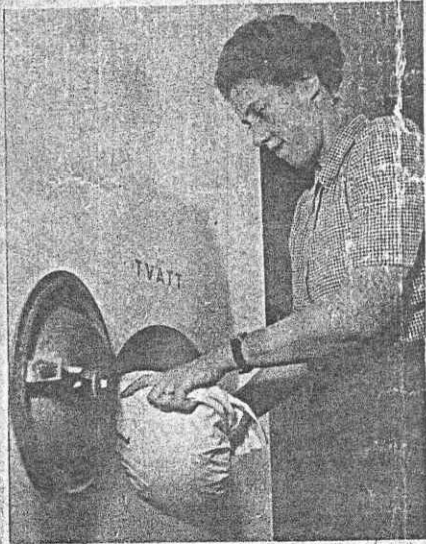
TVÄTTEN buntas i knyten och kastas därefter ned i tvättnekastet. Efter några dagar får lägenhetsägaren upp den igen, tvättad, manglad, struken — och lagad om så önskas.