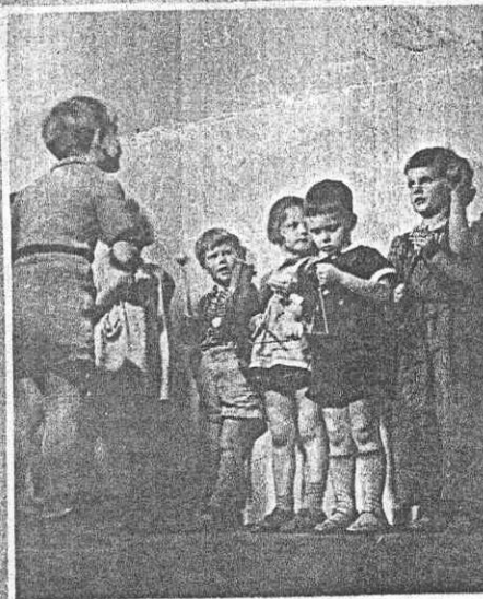
KOLLEKTIVHUSET har sin egen lilla orkester nere i den rolliga och inventiösa lekstugan. Orkestern är kanske inte så stor, men den åstadkommer en hel del ljud.