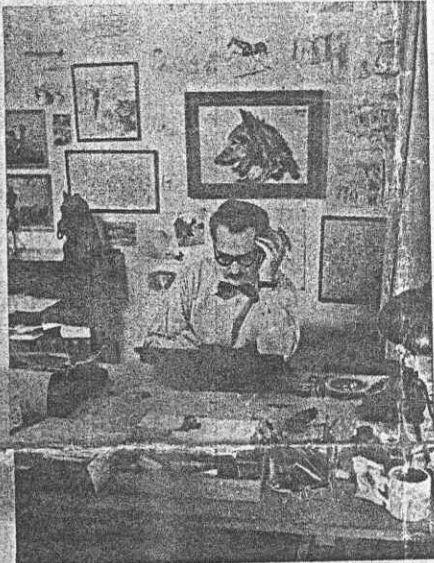
»PÅ TAPETEN» i Aftonbladet förekommer tydligen också i verkligheten i konstnären Bertilas arbetsrum en trappa under balkongen.