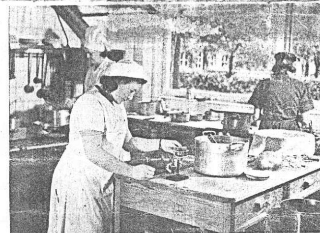
I det hypermoderna centralköket finns alla rationaliserande hushållsmaskiner installerade. Genom köksfönstret har personalen en vacker utsikt mot en planterad gård, där husets barn har en aldeles utmärkt lekplats.