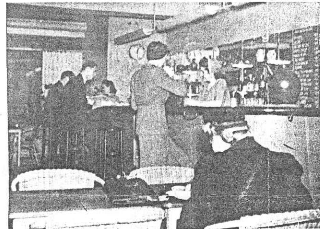
»Kollektivhusbaren» hör till favoritrestaurangerna för grannkvarterens gräsänklingar och ungar. Lunch serveras för 1:60 och middag för 1:80. Husets invånare föredra vanligen att få maten skickad pr mathiss.