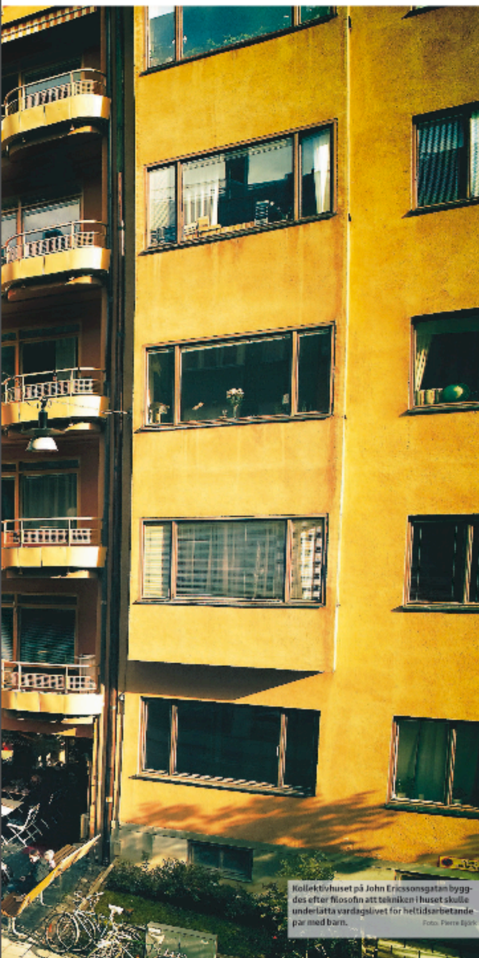
Kollektivhuset på John Ericssonsgatan byggdes efter filosofin att tekniken i huset skulle underlätta vardagslivet för heltidsarbetande par med barn.

På John Ericssonsgatan 6 står ett funkis hus med putsad fasad, rundade balkonger och vinklade burspråk. Men Markeliushuset är inte bara en välbevarad arkitektonisk pärla utan en knutpunkt för ett nytänkande som förändrade Sverige.