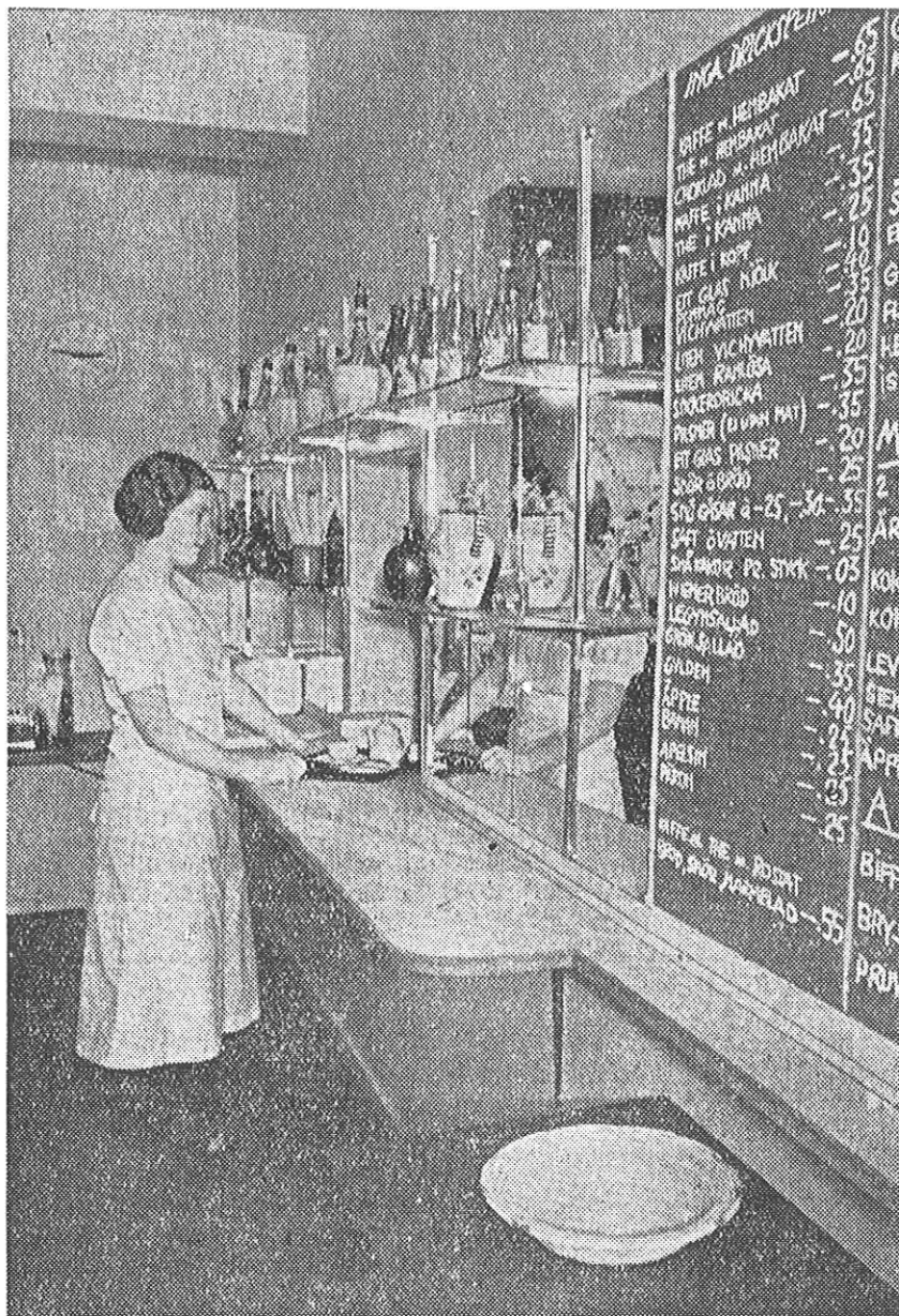
Centralkøkkenets Udlevering. Læg Mærke til Prislisten til højre.