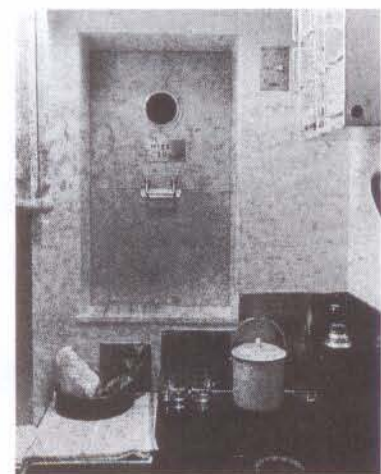
– Mathissarna är upprustade och i funktion!