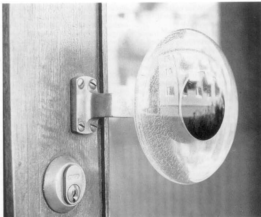
Världen speglad i ett dörrhandtag.

CHRISTOFER NÖRING Arkitekt SAR, Linköping